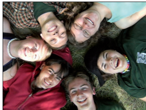
Teilnehmer eines Workcamps, Foto: Landesverband Sachsen, Volksbund Deutsche Kriegsgräberfürsorge

Für Auskünfte steht die Jugend- und Schulreferentin Natalie Hohmann des Landesverbandes Sachsen unter der Telefonnummer (03 51) 3 14 37 30 zur Verfügung. Weitere Informationen gibt es auch via E-Mail: jugend-sachsen@volksbund.de und natalie.hohmann@volksbund.de sowie auf den Webseiten: www.jaksachsen.de und www.volksbund.de .