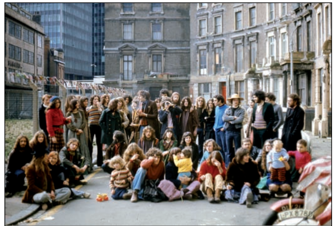
Tolmers Square, London - Hausbesetzer

Düstere Fotografien von John Savage oder Homer Sykes zeigen ganze Londoner Stadtteile, die durch spekulativen Leerstand zugrunde gingen, aber auch alle Formen des wachsenden Protests, der in seiner konstruktiven Form neuen Zusammenhalt erzeugte. Neben der Hausbesetzerzene thematisiert die Ausstellung die feministische und die Schwulenbewegung, den Arbeitskampf in den Fabriken und die Solidarität mit den internationalen Befreiungskämpfen. Vor dem Hintergrund des wirtschaftlichen Niedergangs des Landes entwickelte sich in der