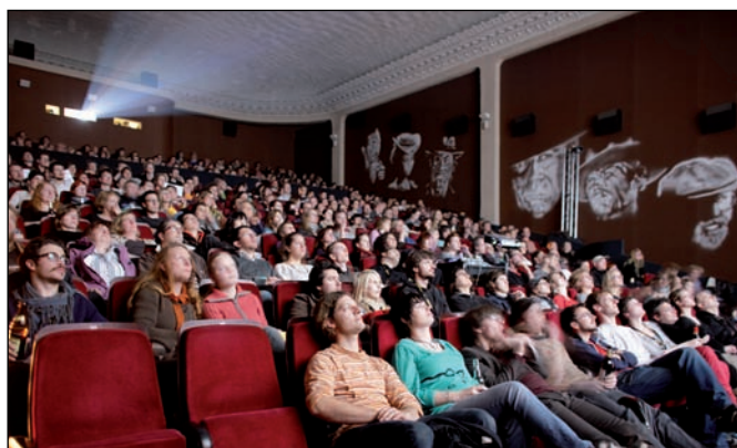
Publikum Filmfest Dresden in der Schauburg

darauf, zur feierlichen Preisverleihung auf ihre Gewinner zu treffen. Auch das Publikum darf per Abstimmung wieder seine Wettbewerbs-Favoriten auszeichnen und darüber entscheiden, welche Filmemacher Dresden auf ewig in glückseliger Erinnerung behalten werden. Neben den zehn hochkarätigen Wettbewerbsblöcken versprechen außerdem 28 Sonderfilmprogramme cineastische Genuss-erlebnisse in vollem Umfang, darunter die Sonderreihe zum Thema Fotofilm mit drei Filmprogrammen und einer Ausstellung. Die vier Hauptspielstätten, das Filmtheater